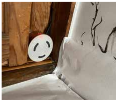
# 芸術村の日常 # 展示の片隅で

展示の片隅で微笑む笑顔を見つけました。よく見るとスピーカーなのですが、どう見てもスマイルフェイス。ワークショップの展示室で優しく見守っているかのように、そこに居ます。ご来館の際は、スマイルフェイスを探してみてくださいね。