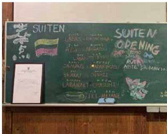
オープニングパーティの時に、黒板に書かれたリトアニア語と日本語のあいさつ。展示期間中は、そのままに残っていますので、見てみてくださいね。