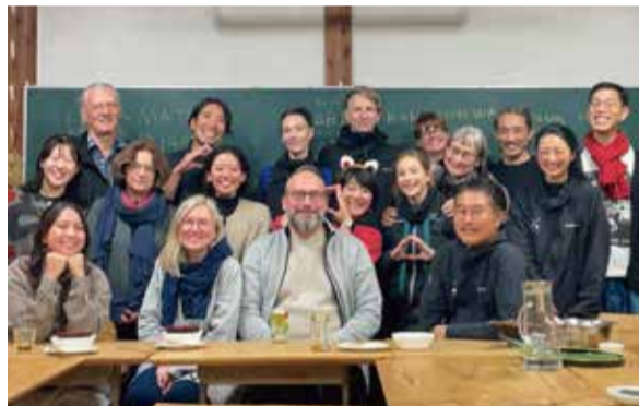
アーティストたちとの交流会