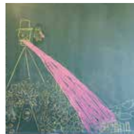
#黒板 #アート #チョーク #好きなように

#写真撮影の舞台裏 まぼろしレストランには黒板があり、週末には子供たちが好きなように描いたり、書いたり...黒板アートが仕上がります！