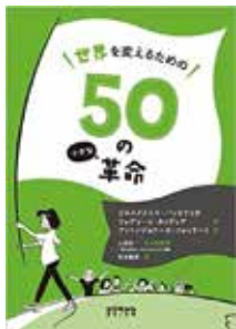
この本は、「じぶんカフェ」にてお読みいただけます。

芸術村スタッフのおすすめの本をご紹介します。今月は清野が担当します。 世界がよりよくなる50の革命ガイドブック！聞いただけでワクワクしませんか？ イタリア発のこの書籍、難しいことを楽しく軽やかにやってみようというコンセプトはさすが。SDGsをテーマに、暮らしのちよつとの変化が世界を変えるワクワクと勇気をもたらせる本です。