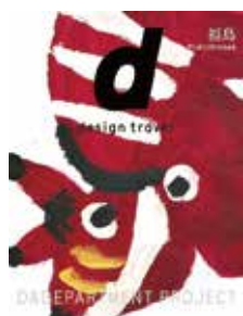
この本は、「じぶんカフェ」にてお読みいただけます。

芸術村スタッフのおすすめの本をご紹介します。今月は山口が担当します。デザイナーナガオカケンメイ氏によるロングライフデザイン活動の一環として発行される、デザインの視点で新しい観光を提案するガイドブック。二〇〇九年の創刊以来全国三十箇所目ようやく、待ちに待った念願の福島号です。編集長が体験したおもしろいが詰まっています、じぶんカフェには芸術村との関係などのメモを挟んで置いてあるので見てみてください。