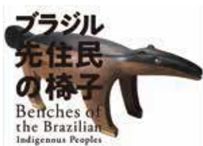
この本は、「じぶんカフェ」にてお読みいただけます。

二〇一八年に行われた「ブラジル先住民の椅子展」の記録になります。ブラジル先住民が作った一木造の椅子を見ることが出来ます。特に動物を模したものは宗教的な儀式で用いられていたようで、見えていて引き込まれる魅力があります。椅子のデザインがとても可愛いので、パラパラと気軽に見ていただけたら嬉し