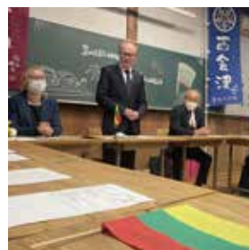
#リトアニア #そば会

萱本そば会の主催で、県内のそば関係者を交えて情報交換、交流会を開催しました。在日リトアニア大使館の臨時代理大使一行が来館し、美味しいそばを楽しんでいりました。