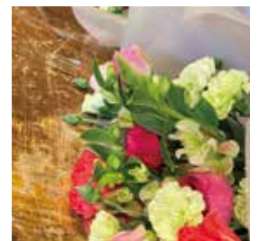
# 花束 # 卒業 # お花屋さん

臨時花屋さんが開業した。 花束をもらった人も あげた人も笑顔の日に。 今まで、お疲れ様でした。