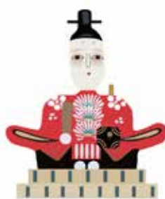
かざるのは 会津だけでしょうか