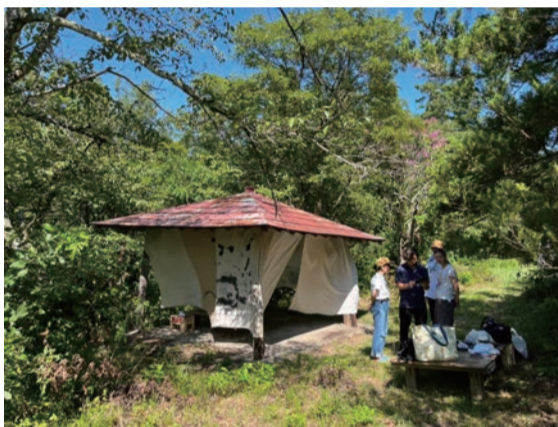
過去の活動の様子《ものがたりの層》2022年