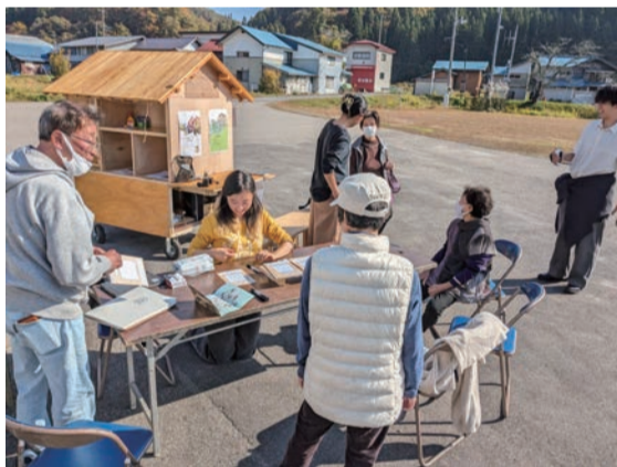
過去の活動の様子《えんの繋ぎ目》2023年