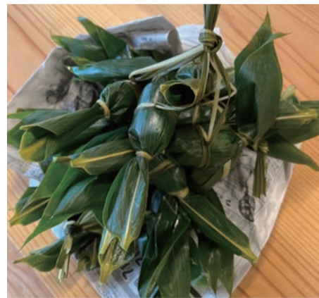
# 芸術村の日常 # 笹団子 # 郷土の味

先日、地域の方から見事な 笹団子をいただきました。こ の時期の笹でスゲも美しく、 光り輝いて見えるほど。上新 粉で作った団子には粒あん という好きな組合せ！ 最近、笹団子の冷凍品もあ るので、年間を通じて食べら れるようになったのはいいと ころですが、やはり、この時 期の作りたての家庭の味は格 別でした。